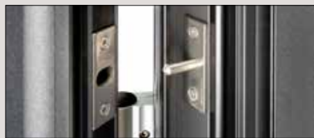
2 Bolzensicherungen im oberen und unteren Bereich verhindern das Aushebeln des Türflügels (Einbruchschutz)