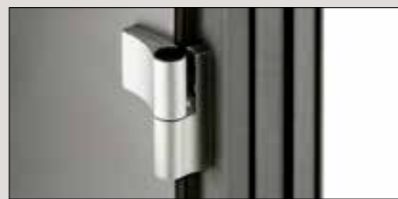
3 Türbänder dreidimensional einstellbar ohne Aushängen des Türflügels