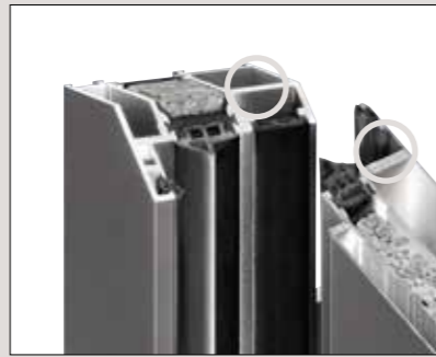
Wandungsstärke bis 3 mm bietet einen sicheren Halt für Schloss und Bandbolzen