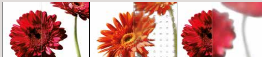
Verglasung: Klarglas (links) / Mastercarré (mitte) / Satinato (rechts)