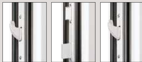
Dreiriegelhakenschluss für optimalen Einbruchschutz