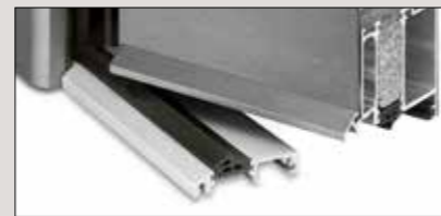
Wetterschenkel im Flügel vernietet, Wasser tropft von der Schwelle ab