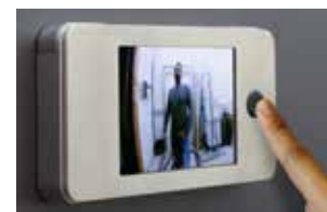
Aufgesetzt für Express