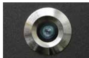
Groke Linse Schutzklasse IP65