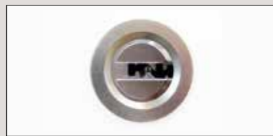
Rundrosette aus Edelstahl außen, inkl. Profilylinder mit Not- und Gefahrenfunktion (Aufschließen trotz innen steckenden Schlüssels)