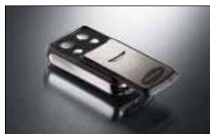
Slider 4-Befehl Handsender