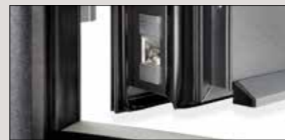
Eckverbindungen äußerst stabil, Profile auf Gehung verschraubt, verklebt und verbolzt