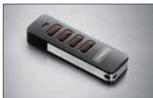
Pearl 4-Befehl Handsender