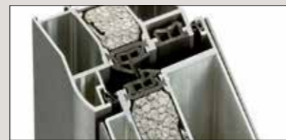
3 Dichtungsebenen garantieren optimalen Schutz gegen Wärmeverlust durch Zugluft