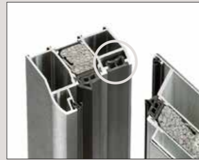
Montagenut für verdeckt liegende Rahmenverschraubung, deckt Schrauben ab, dadurch leichter zu Reinigen